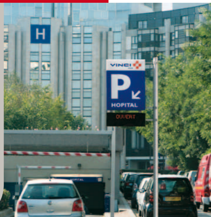
Trauma Center de Marseille (13)