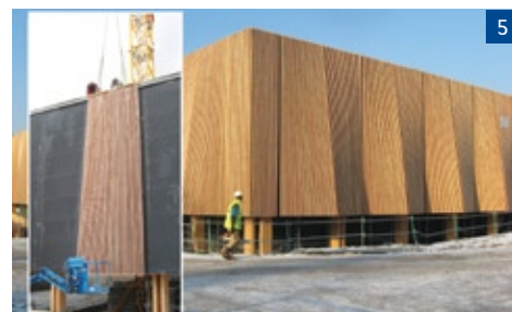
Ministère de la Jeunesse des sports et de la vie associative, EMOG