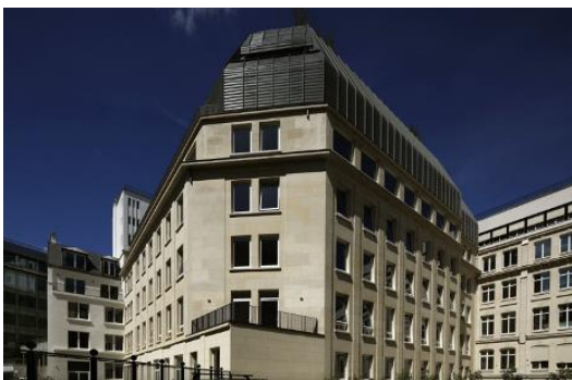
Restructuration du 7 rue de Madrid – Paris, 8 e