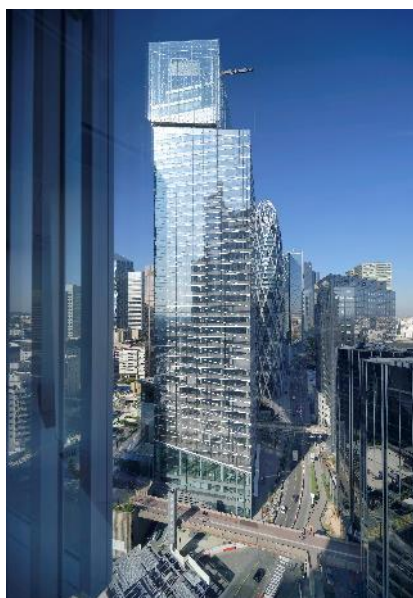
Réalisation de La Tour Saint-Gobain – Paris La Défense