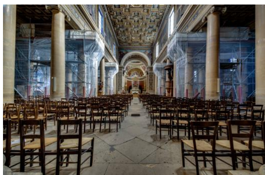
Restauration de l'église Notre-Dame de Lorette – Paris, 9 e