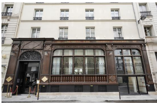
Rénovation de Maison Albar Hotels Le Vendome – Paris, 9 e