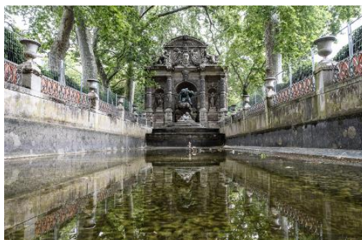
Restauration de la Fontaine Médicis et de ses bassins – Paris, 6 e