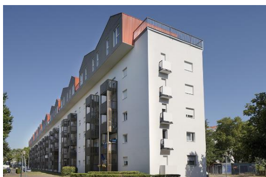
Réhabilitation de la Résidence Beauregard – Poissy (78)