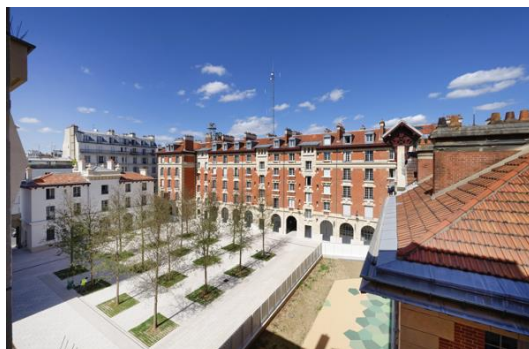
Réhabilitation de la Caserne des Minimes – Paris, 3 e